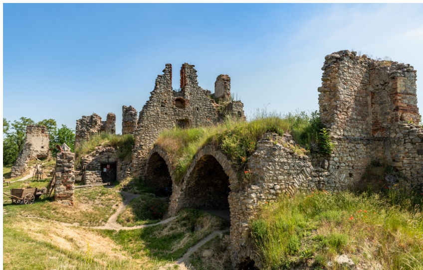
Zřícenina hradu Zvířetice

Náves ve Zvířeticích – zřícenina Zvířetice (1 km) – Bítouchov (2,5 km) – neznačená polní cesta (3 km) – obec Zvířetice (3,5 km)