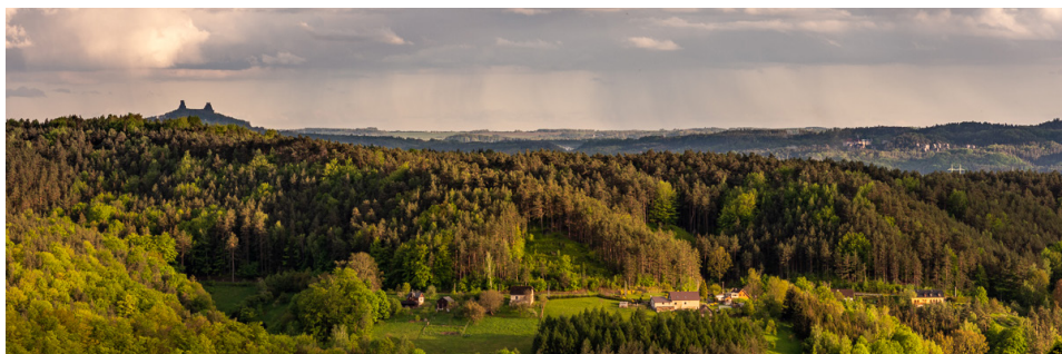
Pohled na Trosky

Upozornění: Besedické skalní město a zřícenina hradu Zbirohy nejsou pro osoby s pohybovým hendikepem ani pro kočárky přístupné. Trasa ale nabízí krásné výhledy na vrch Kozákov, Klokočské skály, Hruboskalské skalní město a na údolí řeky Jizery.