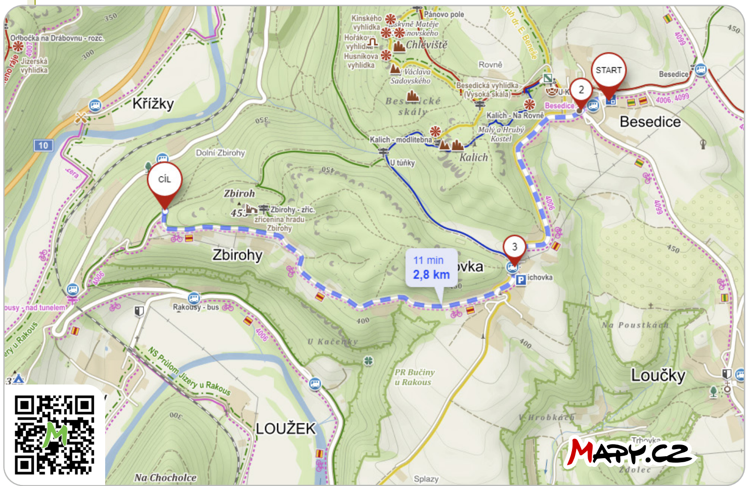
3. KOLEM BESEDICKÝCH SKAL