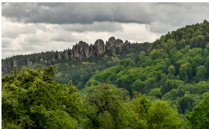
Pohled na Suché skály

Výlet začnete na štěrkovém parkovišti u Dlaskova statku (bez vyhrazených míst pro vozíčkáře). Z parkoviště se dejte vlevo po modré cyklotrase č. 4007. Po 300m odbočte na křižovatce doprava na modrou cyklotrasu č. 3051, projděte pod viaduktem a pokračujte po rovině zakončené středním stoupáním, které vás zavede k Bartošově peci. Pak následuje prudké stoupání v délce 500m (kritické místo). Na následujícím rozcestí se dejte vpravo a vystoupejte ještě dalších 100m.